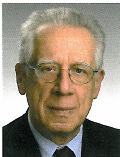
トマツソ・パドア・スキオツパ Tommaso Padoa-Schioppa

He joined the Ministry of Finance in 1978 and served in a variety of bureaus such as Tax, Securities, Budget, International Finance, before taking present post in 2009. He also worked for the IMF from 1994 to 97, and served as Minister at the Embassy of Japan in Washington, D.C., from 2005 to 07. Received MBA from University of California at Berkeley.