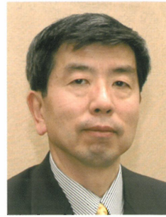
中尾 武彦 Takehiko Nakao