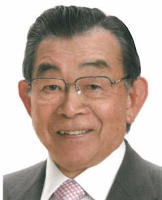
行天 豊雄 Toyoo Gyohten

Mr. Jean-Claude Trichet is a graduate of the Université de Paris (in economics) and of the ENA. He was assigned to various posts at many governmental agencies including Ministry of Finance and Treasury Department. He was appointed as Governor of the Banque de France in 1993 and later served as President of the European Central Bank from 2003 to 2011. Currently he is the Chairman of the G30 and an Honorary Governor of the Banque de France.