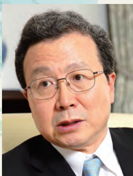
程永華 Cheng Yonghua

中華人民共和国外交部に入省後、1977年、中華人民共和国駐日本大使館のアタッシェとして来日。1983年に中国へ戻り、外交部アジア局に勤務。その後、二回の駐日大使館での勤務（1989～92年と1996～00年）と外交部アジア局での勤務を経て、2003年中華人民共和国駐日本大使館公使として来日。マレーシアと大韓民国の特命全権大使として勤務の後、2010年より中華人民共和国駐日本国特命全権大使。