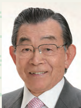
行天 豊雄 Toyoo Gyohten

After joining the Ministry of Foreign Affairs of the People's Republic of China, Mr. Cheng Yonghua came to Japan as an Attaché of the Embassy of the People's Republic of China to Japan in 1977. Afterwards, including two assignments at the Embassy of the People's Republic of China to Japan (1989 to 1992 and 1996 to 2000) and several assignments at the Department of Asian Affairs Ministry of Foreign Affairs, he came to Japan in 2003 as the Minister, Embassy of the People's Republic of China to Japan. After being the Ambassador Extraordinary and Plenipotentiary of the People's Republic of China to Malaysia and Korea, he has been the Ambassador Extraordinary and Plenipotentiary of the People's Republic of China to Japan since 2010.